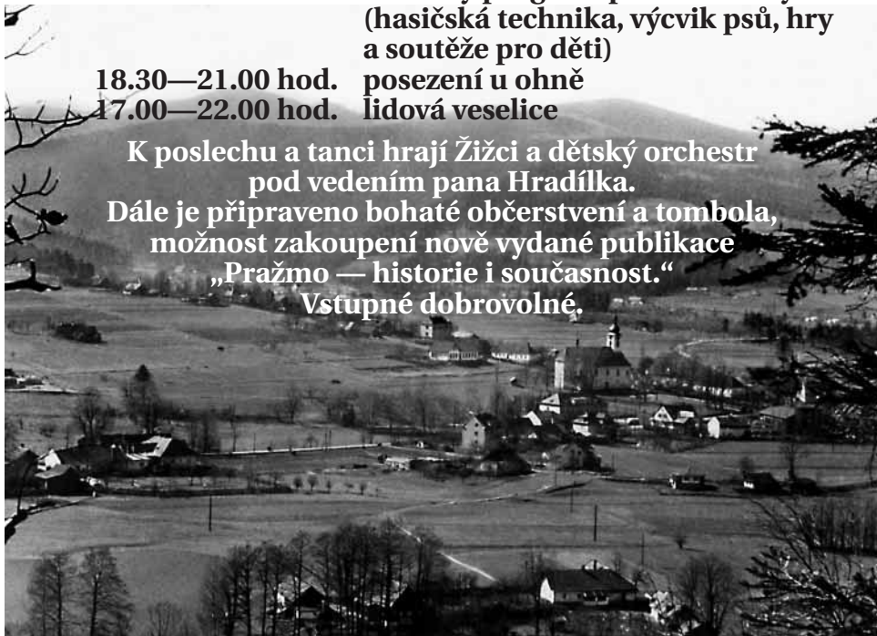
Pohled na Pražmo v roce 1958.

Dále je připraveno bohaté občerstvení a tombola, možnost zakoupení nově vydané publikace „Pražmo — historie i současnost.“ Vstupné dobrovolné.