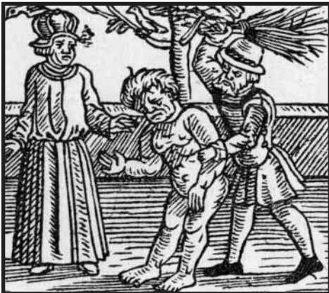
Způsob tělesného trestání dorostu podle vyobrazení ze 16. století. (Ezopovy bajky.)

Tato pověst má historický základ. Prý „reprodukuje dosti věrně skutečnou událost.“ Hrabětem měl být